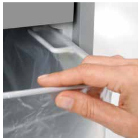
Wyciągnij zaokrągloną górną ramkę kiedy wymieniasz worek na ścinki