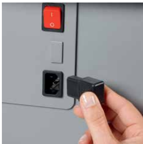
Wyjmowana wtyczka zasilania sprawia że łatwo przenieść niszczarkę z punktu A do punktu B