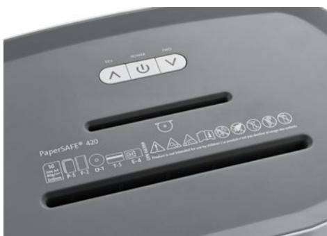
Niszczarka do dokumentów DAHLE PaperSAFE® 420