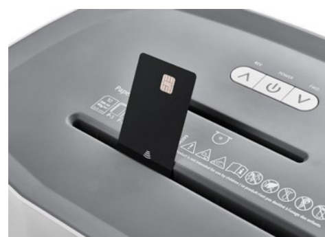
Niszczarka do dokumentów DAHLE PaperSAFE® 420