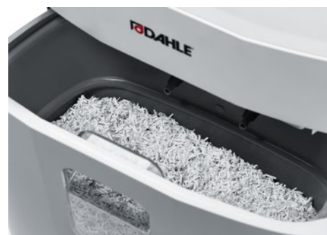
Niszczarka do dokumentów DAHLE PaperSAFE® 420