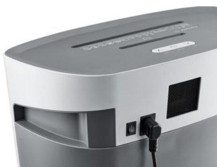
Niszczarka do dokumentów DAHLE PaperSAFE® 420