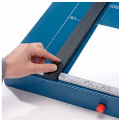
Regulowany metalowy ogranicznik tylny na śrubkę do szybkiego dopasowania formatu - może być mocowany na obu listwach