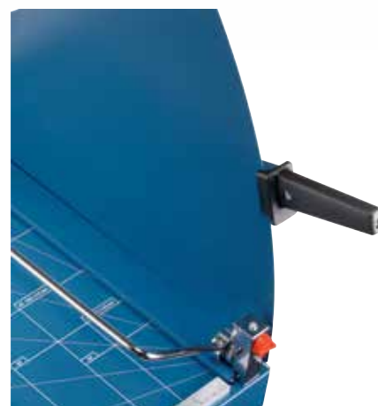
Przezroczysta osłona ostrza