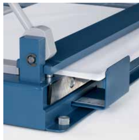
Mocna gilotyna Dahle 564, tnie aż do 50 kartek papieru