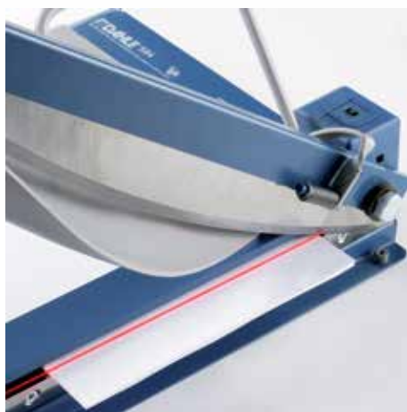
Precyzyjny wskaźnik laserowy gwarantuje profesjonalne rezultaty cięcia