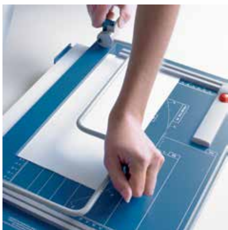
Docisk dźwigniowy dla stabilnego utrzymania ciętego materiału