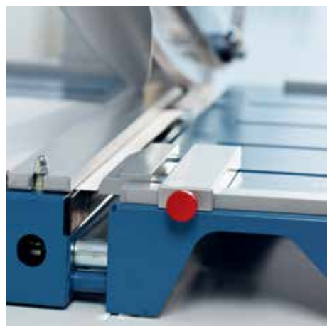
Przedni blat z łącznikiem magnetycznym do zwiększenia obszaru roboczego