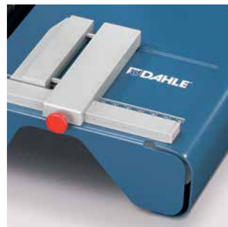
Precyzyjny mechanizm do cięcia wąskich pasków