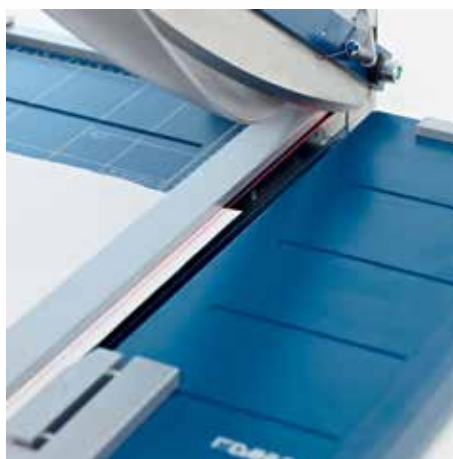
Precyzyjny wskaźnik laserowy gwarantuje profesjonalne rezultaty cięcia