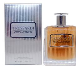
Woda toaletowa TRUSSARDI Riflesso 50 ml dla niego

Sprzedaż promocyjna została zorganizowana przez HSM Polska sp. z o. o. z siedzibą w Warszawie (dalej Organizator). Regulamin sprzedaży promocyjnej dostępny jest w siedzibie Organizatora. Czas trwania promocji: od 25.02.2019 do 14.06.2019 lub wyczerpania zestawów objętych promocją (lub ziszczenia się innego zdarzenia opisanego w Regulaminie). Produkty oferowane w ramach promocji mogą różnić się od tych ukazanych na zdjęciach i opisach, jednakże ich użyteczność będzie na porównywalnym poziomie. Niniejsza treść nie stanowi oferty w rozumieniu art. 66 par.1 Kodeksu Cywilnego. Zakupione w ramach niniejszej promocji urządzenia nie podlegają zwrotowi. Organizator zastrzega sobie prawo do zmiany Regulaminu bez podania przyczyny.