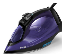
Żelazko parowe Philips PerfectCare