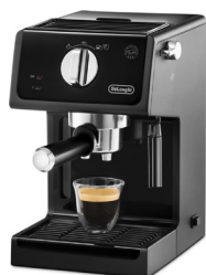
Ciśnieniowy ekspres kolbowy DeLONGHI