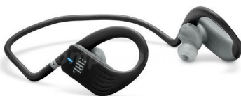
Bezprzewodowe słuchawki sportowe JBL