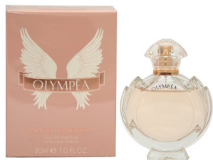
Woda perfumowana PACO RABANNE Olympea 30 ml dla niej