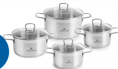
Zestaw garnków GERLACH BRAVIA